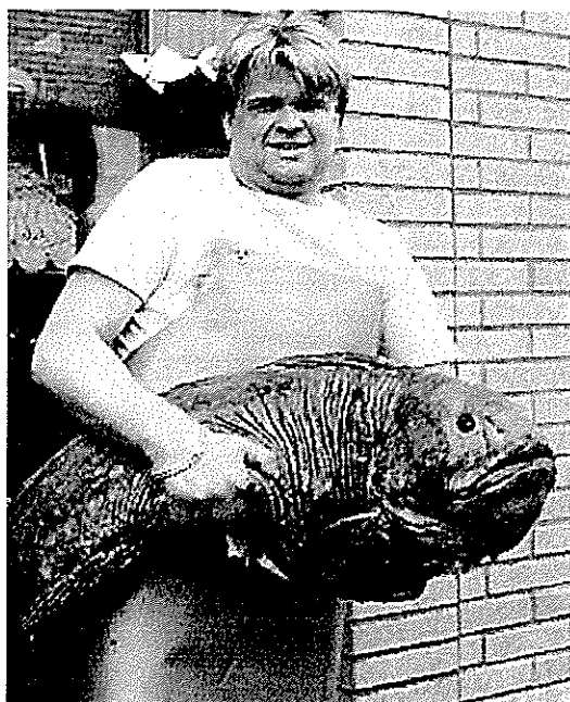
Blå havskatt, 18,7 kg rensad / gutted, 108 cm