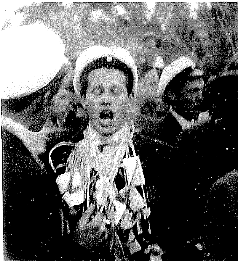
Elev 214 har blivit Kandidat Norrman

föreslag att vi skulle förlova oss drog jag mig tillbaka. Jag var fri från alla måsten från alla håll. För första gången var jag en helt frigående ung grabb, Så var då min skoltid äntligen slut . Vad skulle jag göra? De flesta av mina studentkamrater ryckte in i militärtjänst. Våren 1949 fick jag göra militärtjänsten vid Lv 5 i Sundsvall. Vid kadettskolan i Linköping blev jag sjuk i pernisiös anemi och därmed olämplig som soldat. 26 månader var ej helt förspild tid . Jag fick nya erfarenheter, vänner och kunde ta del i det eviga tjatet om lumpen. Jag har varit reservofficer en månad, utnämningen och entledigande kom i samma kuvert men med en månads tidsskillnad. Att jämföra med min Solbackatid fyra och ett halvt år går inte. Den tiden är ett smultronställe.