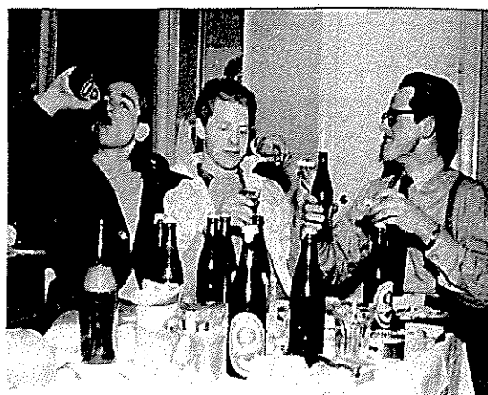
Gamfest på Olympen