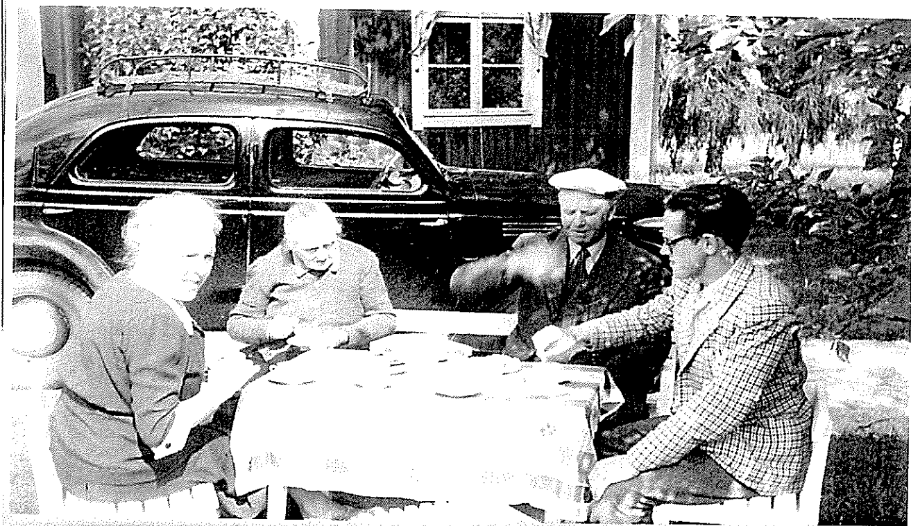
Familjen 1944 på besök hos farmor. Bilen en Volvo 54 med gengasaggregat, på taket ett räcke där träkolen i 100 liters säckar fraktades. Huset är rött. Lärkträden finns kvar. Kaffet gott.